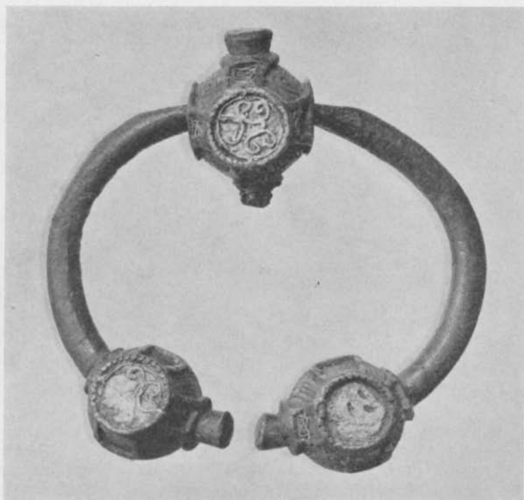
Fig. 1. Ringspänne. Obekant fyndort i Norge. — Penannular brooch. Unknown find-place in Norway.