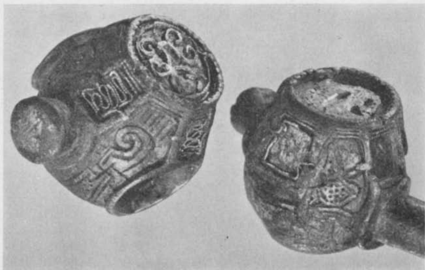
Fig. 2. Detaljer av ringspännnet fig. 1. — Details of penannular brooch fig. 1.

vid tiden för dessa ringspännens tillkomst är säkert belagd på de brittiska öarna, och att den dessutom har gamla traditioner där. 5 Man kan således inte hänvisa till denna detalj för att hävda ett skandinaviskt ursprung. Inte heller bandmönstret torde vara något genuint skandinaviskt, trots att det i 900-talets nordiska konsthantverk återupprepas i det oändliga. Det är de i ringar inflätade öglekorsens och ringkedjans förlovade tid, och man kan lugnt påstå, att intet av dessa motiv till sitt ursprung är nordiskt, hur mycket nordiska forskare än har försökt fasthålla vid en sådan uppfattning. 6 Ingen kan där- emot förneka att öglekorsmotivet förekommer i otaliga variationer i handskrifter, på metallföremål o. s. v. på de brittiska öarna. Ej heller kan man komma ifrån att ringkedjemotivet där kommer till livlig användning. Man