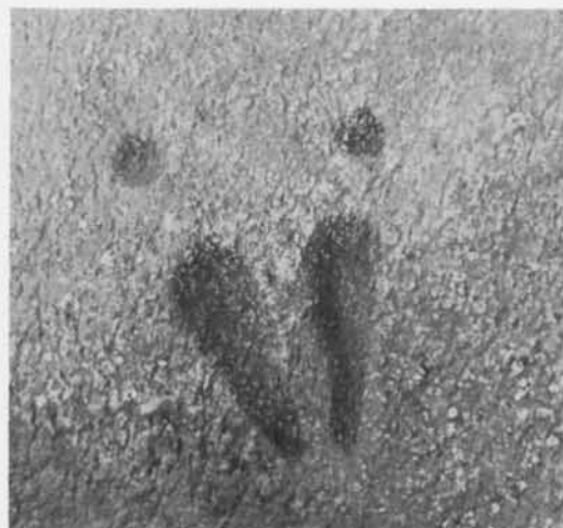
Fig. 1. Stensättningen från V med hällristningsblocket i förgrunden. T. v. blockets översida. Ovan. Klöven, 20 cm lång. Foto förf. – The stone-setting from the west with the rock-carved boulder in the foreground. Left, the upper side of the boulder. Top, the hoof, 20 cm long.