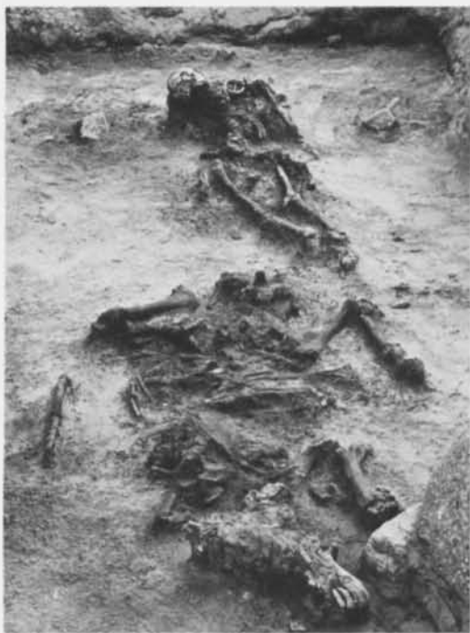
Fig. 1. Ryttargraven i Västkinde, Gällungs 1:9, helt framrensad. Hästskelettet i förgrunden. Märk hur ryttarens skalle av rötter kraftigt pressats åt vänster. – Horseman's grave at Västkinde, Gällungs 1:9, completely excavated. The skeleton of the horse in the foreground. Note how the man's skull has been pressed to the left by roots.

Överkropp och underkropp paraffinerades in och togs som preparat till Riksantikvarieämbetets Gotlandsundersökningar