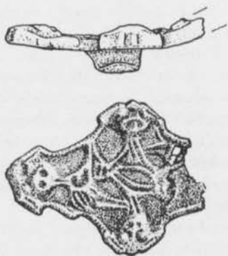
Fig. 2. Del av ett likarmat spänne funnet i anläggning 21, Raå 118, Helgö, Ekerö sn, Uppland, SHM 30 710:21:58. (Teckning C. Bonnevier.)

På gravfältet inom Raå 118 på Helgö har ytterligare två likarmade spännen av brons hittats, daterade till vikingatidens första hälft. Även dessa spännen är mindre vanliga. Ett av spännena har jag ännu inte hittat någon direkt parallell till (se fig. 2), men det har vissa likheter med den spännetyp som av Petersen fått beteckningen P 67 (Petersen 1928, s. 83 f.). Spännet framkom i en grav med bl.a. ca 200 glas- och glasflusspärlor. Det andra spännet är ett s.k. Valstaspanne (se fig. 3), namngivet efter den fyndplats där det först påträffades.