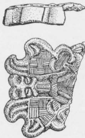
Fig. 1. Del av ett likarmat spänne funnet i anläggning 14, Raå 118, Helgö, Ekerö sn, Uppland, SHM 30 710:14:68. (Teckning C. Bonnevier.)

Trots att det nu är tjugo år sedan de sista arkeologerna från Helgöundersökningen satte spaden i jorden på Helgö, händer det fortfarande att nya fynd från dessa undersökningar dyker upp. Vid en genomgång av det arkeologiska materialet från Raå 118 upptäcktes nyligen en del av ett likarmat spänne (fig. 1). Det hade påträffats som en korrosionsklump. Efter konserveringen var det märkligt nog ingen som reflekterade över den rikt ornerade bronsbit som konservatorn fått fram ur den korroderade klumpen.