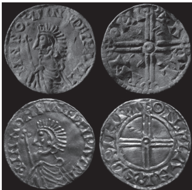
Fig. 1. Två rariteter från samma skatt – hittade med 173 års mellanrum.

A, (upptill). Det nyfunna, ännu inte konserverade myntet med tidigare odokumenterad från-sida av typen Long Cross. Namnet Ulf ses i omskriften.