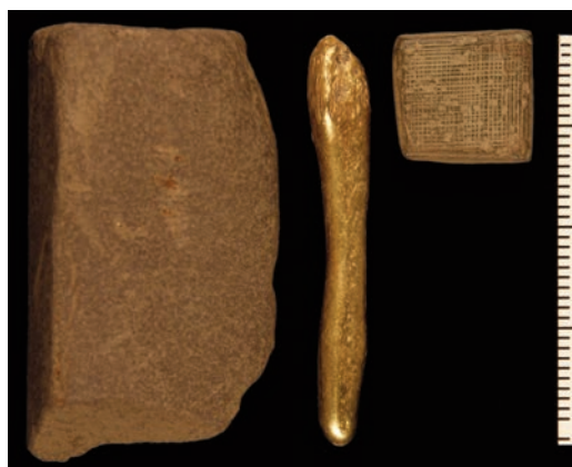
Fig. 7. Matrise av kobberlegering, gullbarre og mulig proberstein fra område 3: C59577/32, C59577/5, C59577/113. Foto: Birgit Maixner, KHM. —Bottom die, gold ingot and possible touchstone from area 3.

På nabogårdene til Missingen/Åkeberg er det så langt kun metallsoekt i meget begrenset omfang i privat regi. Allikevel avslørte de første prøvesøkene både på gården Hovland sør for Missingen/Åkeberg og på gården Borge vest for Missingen/Åkeberg funnkonsentrasjoner fra jernalderen og middelalderen som omfattet bl.a. spenner fra folkevandringstiden og merovingertiden og spor etter metallhåndverk i form av klumper av smeltete kobberlegeringer. På Borge ble det dessuten funnet et lite sylindrisk vektlodd av kobberlegering på én av lokalitetene.