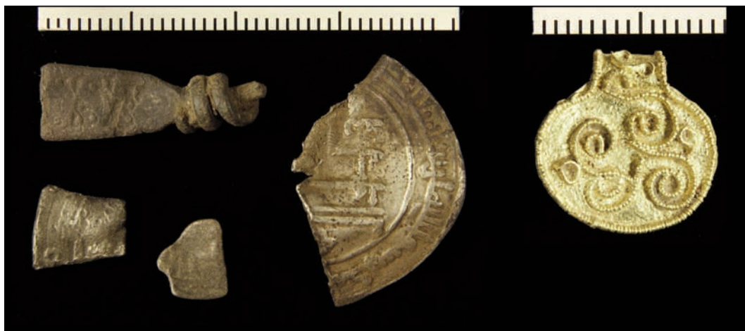
Fig. 4. Edelmetallgjenstander fra vikingtid: tre dirhemfragmenter og et fragment av en (arm)ring av sølv fra område 3; et hengesmykke av gull med filigrandekor fra område 4: C58939, C59577/1, C59577/2, C59577/116, C58510. Foto: Birgit Maixner, KHM. —Fragments of three dirhems and a silver (arm) ring from area 3; a gold filigree pendant from area 4.