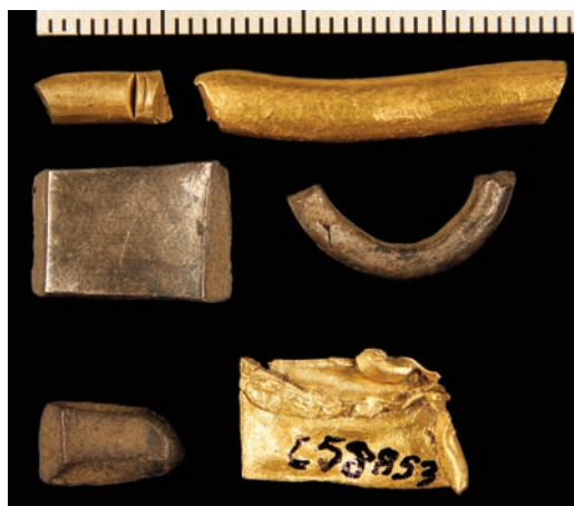
Fig. 5. Bruddgull, bruddsølv, fragment av en sølvbarre og fragment av gullblikk med påsmeltet gulltråd fra område 3: C58855, C58854, C58858, C58857, C58856, C58853. —Gold and silver fragments from area 3.

sikker hva materialet derfra ble brukt til (Resi 2011, s. 152–153). En hjemlig produksjon av perler av bergkrystall i yngre jernalder kunne derimot bli påvist på flere steder på fjelldalene i Sørvest-Norge (Myhre 2005).