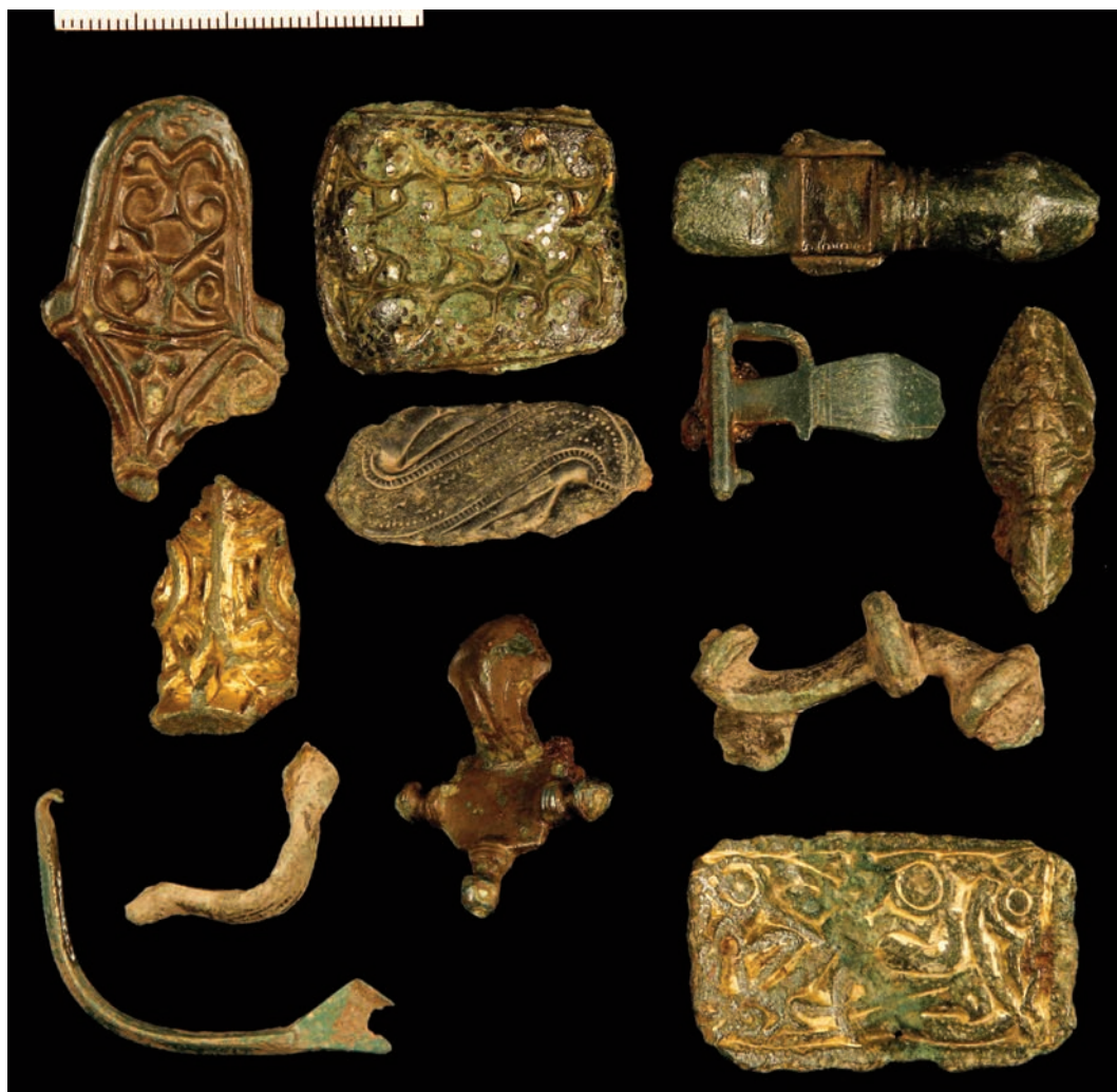
Fig. 3. Et utvalg av drakttilbehør fra område 3. C58257, C 58864, C58866, C58868, C59577/29, C59577/27, C59577/20, C59577/24, C59577/19, C59577/25, C59577/21, C59577/22. —A selection of costume fittings found in area 3.

me og Helgö er vektlodd kjent fra finsmedenes verkstedsområder (Kyhllberg 1980, s. 177; Axboe & Jørgensen 2010, s. 117–118). De to enkle sylindriske vektlodd av bly indikerer dermed håndverk snarere enn handel. Et fragment av en bronsemynt slått under Marcus Aurelius (161–180 e.Kr.) kan ha vært beregnet som råmateriale for bronsestøpning, på lik linje med det som antas å ha vært tilfelle for de romerske bronsemynter fra Gudme (Thomsen et al. 1993, s. 82).