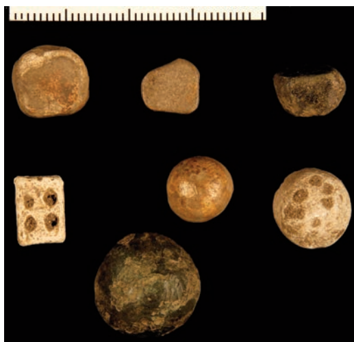
Fig. 6. Et utvalg av vektlodd i kobber- og blylegeringer fra område 3: C59577/40, C59577/43, C59577/37, C59577/38, C59577/49, C59577/47, C59577/36. —A selection of lead and copper-alloy weights from area 3.

hjul og et vektlodd et inntrykk av hva blyet ble brukt til. To barrer av grønn og hvit glass-smelte kan være en første pekepinn på forarbeiding av glass på stedet, men kan ikke med sikkerhet dateres til jernalder eller middelalder. Det samme gjelder strengt tatt også for produksjonsavfallet av metall. Tre dirhemfragmenter, ett av dem daterert til 922 e.Kr. (fig. 4), bekrefter imidlertid at området fremdeles var i bruk mot slutten av vikingtiden.