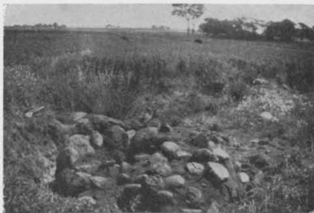
Fig. 34. Röse i enmansgrav från stenåldern från V. Klagstorp sn, Skåne.

En synnerligen intressant markgrav från yngre stenåldern har förf. undersökt i ett grustag å nr 16 i V. Klagstorps socken, Oxie härad. Under ett plant, nästan cirkelrunt röse av ganska stora kullerstenar låg ett tämligen väl bevarat