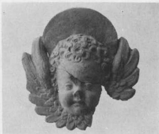
Fig. 1. Änglaansikte funnet vid grävningar inom Nyköpings renässanslott. Största bredd 21,6 cm, största höjd 21,1 cm. Angel's face, found during excavations in the Renaissance Castle at Nyköping. Greatest width 21.6 cm., greatest height 21.1 cm.

I slottsmuseet i Kungstornet på Nyköpings slott förvaras tvenne änglaansikten, påträffade vid grävningar på slottet under 1920-talet (fig. 1). Nyligen har till Statens historiska museum förvärvat fragment av två vad formerna angår alldeles lika ansiktsreliefer (inv.-nr 22.372: 3—7); fragmenten påträffades liggande lösa inuti ett altarskåp från Torpa