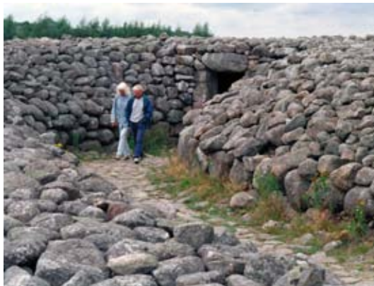
Kiviksgravens hör tillsammans med Lugnarohögen i Halland till de hårt restaurerade monumenten under tidigt 1900-tal.

Vården innebar i det här fallet en ny utgrävning och en hård strid utvecklades kring vem som skulle få genomföra den prestigefyllda utgrävningen. Det blir Gustav Hallström som undersöker graven i sex veckor, ett arbete som bl a resulterade i en mycket fin fotodokumentation. Han fann bl a delar av en svärdsknapp, en fibula och ett kallhamrat bronskärl. Därefter restaurerades röset, som man räknade med hade varit 7 meter högt från början, oerhörda mängder sten gick åt och en bunker göts över stenarna.