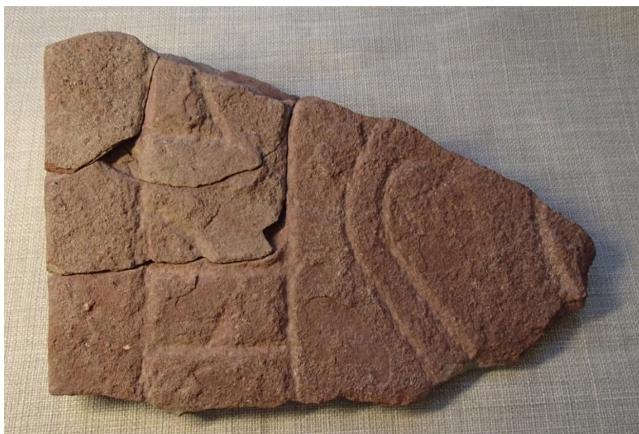
Fig. 1. Runstensfragmentet från Eds allé. Foto Magnus Källström 2016.