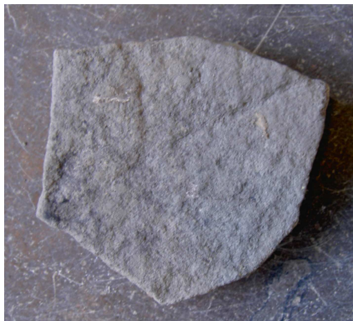
Fig. 1. Ristat sandstensfragment (fyndnr 2402) från Kv. Humlegården, Sigtuna. Foto Magnus Källström 2011.

Röd sandsten. Storlek: 9 × 8 cm. Tjocklek; 2 cm. Fragmentet är inte rengjort. På den ena sidan ses en svagt bågböjd linje till vilken ansluter två andra parallella linjer. Troligen rör det sig om resterna av ett par korsande ornamentslinjer och allt tyder på att fragmentet har tillhört en sönderslagen runsten.