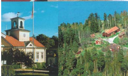
Foton från Eskilstuna översiktsplan.

Dessa antogs av kommunfullmäktige i augusti 2003 och är utformade som mål för den fysiska planeringen i kommunen. De är vägledande vid avvägning mellan olika markanspråk och intressen. Måldokumentet har utgjort ett viktigt styrdokument för översiktsplanearbetet i kommunen och påverkat innehåll och ställningstaganden i planen. I flera av målen är kulturmiljöaspekter invävda. Mål 7 behandlar befintliga kulturmiljövärden: