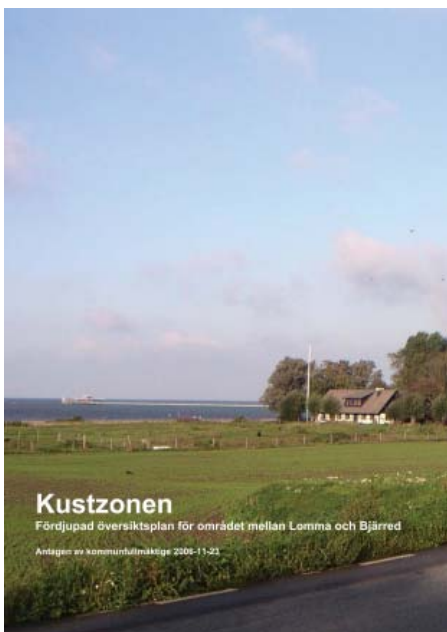
Omslag från Fördjupad översiktsplan för området mellan Lomma och Bjärred.

• "Planeringen för strandstråksvisionen fortsätter."