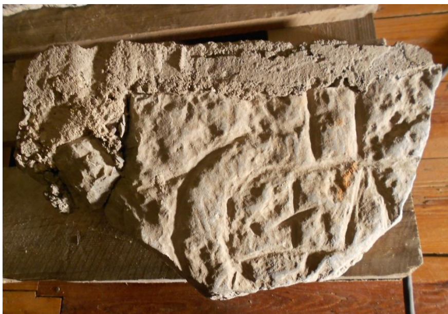
Det tidigare oregistrerade fragmentet i Kalmar läns museum. Foto Magnus Källström 2012.

Materialet är grå kalksten. Fragmentet mäter 27 × 17 cm och är 6,5–7 cm tjockt. Längs ena kanten finns fastsittande hårt grått bruk, vilket visar att stenen tidigare har varit inmurad i en mur eller byggnad. Av ristningen återstår ett runband som nedtill är svagt bågböjt samt delar av en kringelformad bandknut. Ristningen är djup och tydlig med ganska breda ristningslinjer. Runorna är 6,5 cm höga.