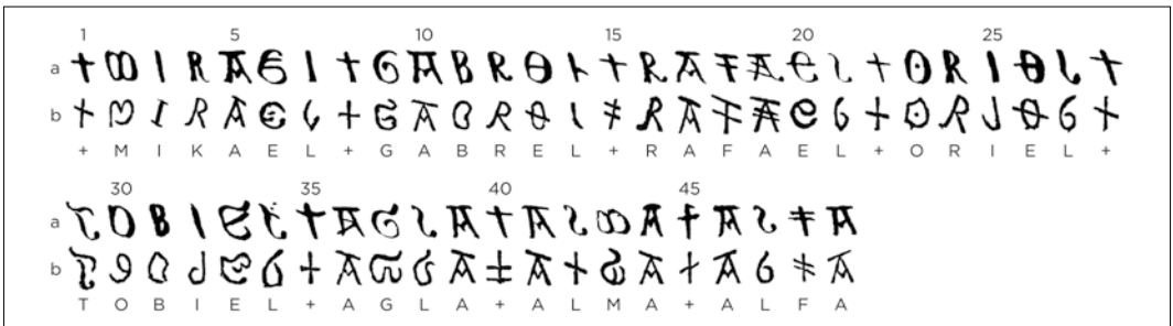
Fig. 2. Fredrik Fryxells (a) och Erik Fernows (b) avskrifter, spegelvända och ställda i läsordning, med tolkning nederst. —The two extant transcriptions of the Grava church bell inscription, by Fryxell (a) and Fernow (b), shown mirrored and in the correct (reverse) reading order. A reading is given in the bottom row.

+MIKAEL+GABR[I]EL+RAFAEL+ORIEL+ TOBIEL+AGLA+ALMA+ALFA