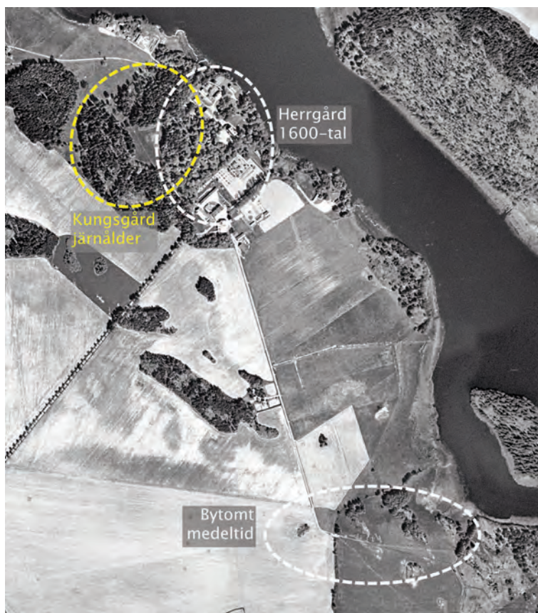
Fig. 3. Översiktskarta över Fornsigtunas domän med järnålderns kungsgård i norr, 1600-talsherrgården Signhildsberg med ekonomibyggnader och medeltidens brytesgård och landboby i söder. Bakgrunden är ett ortofoto från 1960, Lantmäteriet. –The Fornsigtuna Iron Age manor site to the north, the 17th-century manor site, and the site of the bailiff's farm and the tenants' village to the south.

Slottsruinerna förlägger Aschaneus ännu längre västerut och skriver att de återfinns mitt emot Habors slätt på Sigtunasidan av Mälaren. Läget för Habors slätt är känt och på 1817 års karta är det ett torpställe (LSA Signhildsberg B32). Men platsen mitt emot Habors slätt från Trånboda sett ligger inte åt väster utan åt norr. Och syftar man tvärs över fjärden från Habors slätt, där sun-