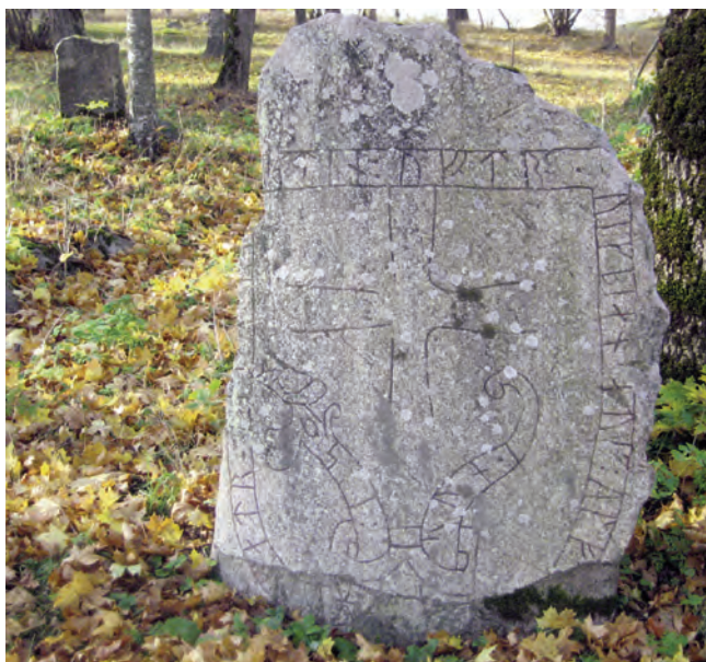
Fig. 6. Runstenen U 662 på nuvarande plats i parken vid Signhildsbergs herrgård. Stenen stod ursprungligen i anslutning till den tidigmedeltida brytesgården. I bakgrunden runstensfragmentet U ATA3600/65. –The runic stone U 662 was originally located near the Fornsigtuna bailiff's farm. Much later moved to its present location in the park of Signhildsberg manor.