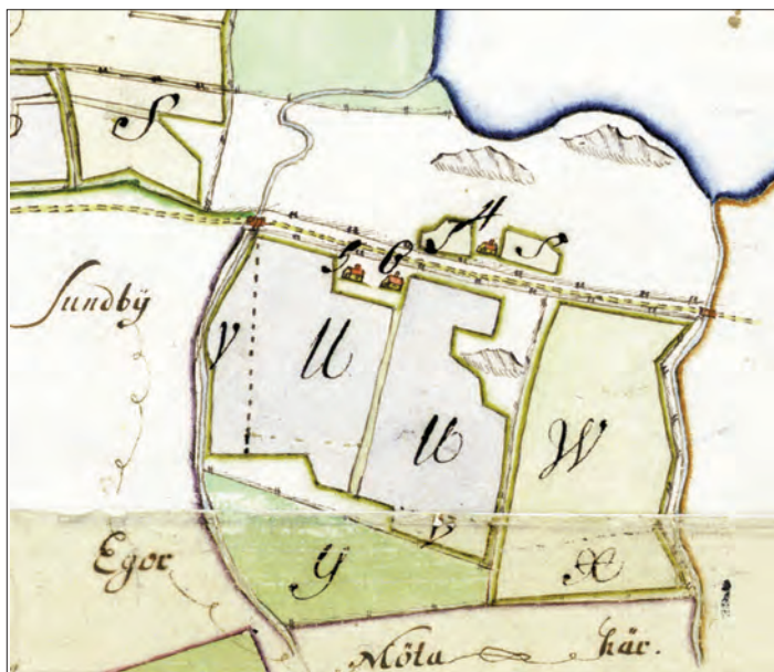
Fig. 5. Utdrag ur 1715 års renoverande Signhildsbergskarta. Av de fyra gårdarna i den antagna medeltida byn återstår här tre, som blivit torp: torpet vid Habors källa (kartans nr 4) och torpen vid Habors vret (nr 5 och 6). Kartans S är åker till torp nr 4, som också har mark utanför kartan. U, V, W och X är åker till torpen 5 och 6. Y är äng. Sundby låg vid denna tid under Aske. —Extract from an AD 1715 cadastral map showing what is left of the village, three crofters' cottages with some arable and pasture, after Fornsigstuna's conversion to a private manor farm.

snittligt beräknats kunna motsvara cirka 12 hektar åker (Ericsson 2012, s. 218f; jfr Hannerberg 1971, s. 37f). Fornsigstunas åkerareal under medeltiden skulle därmed grovt kunna uppskattas till cirka 24 hektar, med andra ord fem gånger mer än vad 1691 års torp sammanlagt fått behålla. För att hålla en ko vid liv under vintern krävdes, enligt källor från 1500-talets Uppland, i storleksordningen 3–4 lass hö (Björnhag & Myrdal 1994) och om ängen varit i motsvarande mån större kunde byn således kunnat vinterställa 15–20 kor.