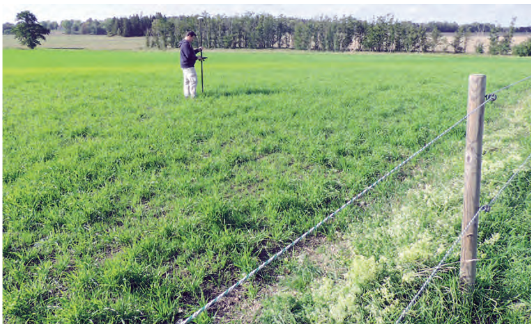
Fig. 7. Platsen där »torpen vid Habors vret» låg enligt kartor från 1691 och 1715, den södra delen av det antagna läget för Fornsigtunas medeltida bytomt. Höjd över havet 6,2–6,9 m. Den östra halvan är nu betesmark, den västra åker. Foto mot norr. —The southern part of the suggested old Fornsigtuna village site, nowadays used as part arable, part pasture.

namn och tre minnesnamn. Fyra är män, det femte namnet har inte kunnat tydas. Ingenting sägs om deras eventuella familjrelationer, vilket är påfallande. Vi har här fem personer som kan förknippas inte bara med Fornsigtuna utan förslagsvis också med de angränsande gårdar vars ägor sammanstrålat i denna för samfärdseln centrala punkt. Är det namn på några av kungens hirdmän – eller brytar? Detta är givetvis hypotetiskt. Stenen är i vart fall samtida med Sigtunas uppblomstring som stad och bör kunna ses som en markering vid den plats där man färjade till och från staden med dess ständiga efterfrågan på bränsle, foder, livsmedel och hantverksråvaror. Den kan föras till den grupp runmonument som markerade vägar, broar, vad och hamnar. De var orienteringspunkter i landskapet (Källström 2015, med där anförd litteratur; jfr Ekholm 1950; Selinge 2010).