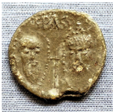
Fig. 1. Bulla från Alexander III, påve 1159–1181. Jordfynd från Sigtuna stad, Sigtuna Museums inv. nr. Sf 3328. Diameter 34–36 mm. —Bull of Pope Alexander III, an archaeological find from Sigtuna town.