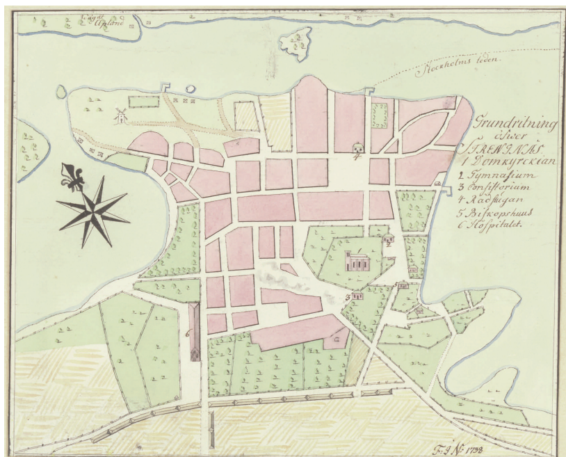
Fig. 1. Karta över Strängnäs, osignerad, 1738 (SE/KrA/0424/145/001).

Foto: Daniel Olofsson, Krigsarkivet. —Map of Strängnäs, unsigned, 1738.