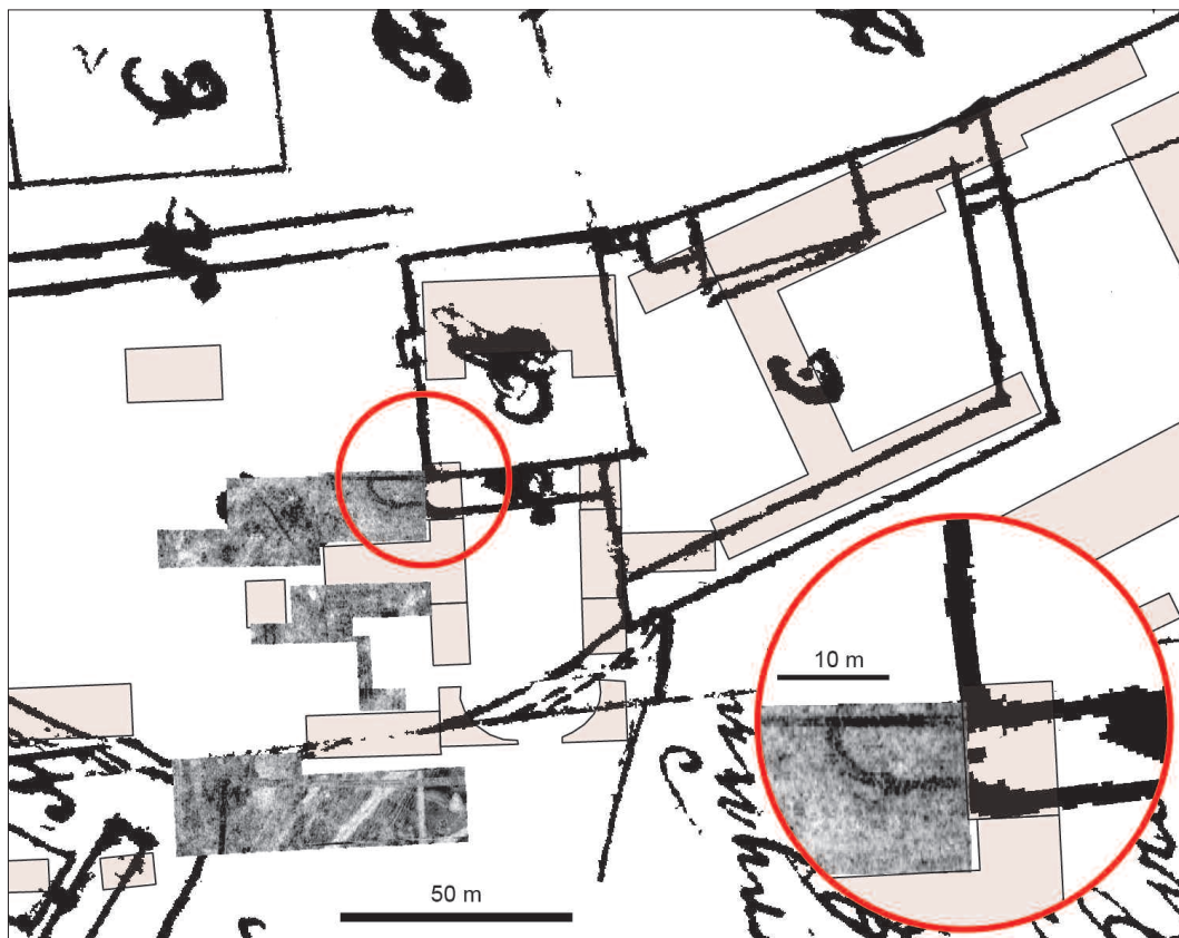
Fig. 2. Stående byggnader (beige) i Övedskloster med markradarresultatet från djupskiva 50–60 centimeter (delvis genomskinlig) på ett utsnitt ur konceptkartan 1726. Klosterkyrkans kor med absid syns inom den röda cirkeln. Skala 1:2000. En förstoring av ytan inom cirkeln finns i bildens nedre högra hörn. Skala 1:800. För att underlätta jämförelser med prospektet från 1680 är kartan orienterad med norr nedåt i bild. Bildbearbetning: Henrik Pihl. —Standing buildings (beige) in Övedskloster with GPR data shown on a land survey map from 1726. A chancel and a semicircular apse are visible within the red circle. Scale 1:2000. An enlargement of the area within the circle is in the lower right corner of the image. Scale 1:800. The chancel and the apse were part of the medieval monastery church. In order to facilitate comparisons with the drawing from 1680, the map is oriented north down in the picture. Image processing: Henrik Pihl.

& Software. Databearbetningen gjordes av Immo Trinks vid Ludwig Boltzmann Institute for Archaeological Prospection and Virtual Archaeology (LBI ArchPro) i Wien. För en utförlig teknisk beskrivning hänvisas till rapporten (Westergaard et al. 2019).