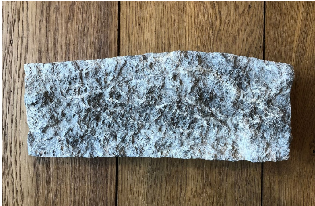
Fig. 2. Baksidan av runstensfragmentet från Hagby kyrka. Foto Magnus Källström 2019.

Runföljden auk återger givetvis konjunktionen ok 'och' (eller möjligen det likalydande adverbet med betydelsen 'också'). Om det rör sig om konjunktionen och denna har ingått i en resarformel bör den föregående r -runan svara mot den sista runan i ett personnamn.