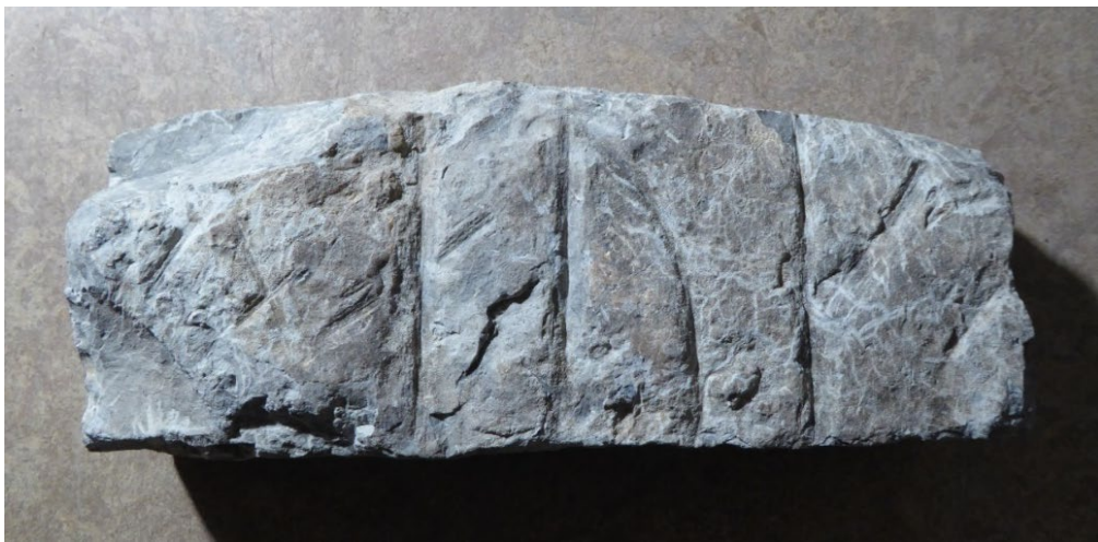
Fig. 1. Det nyfunna runstensfragmentet från Hagby kyrka. Foto Magnus Källström 2018.

Jag undersökte stenen första gången hos Arkeologerna i Linköping den 19 november 2014 med kompletterande granskning och fotografering den 12 april 2018.