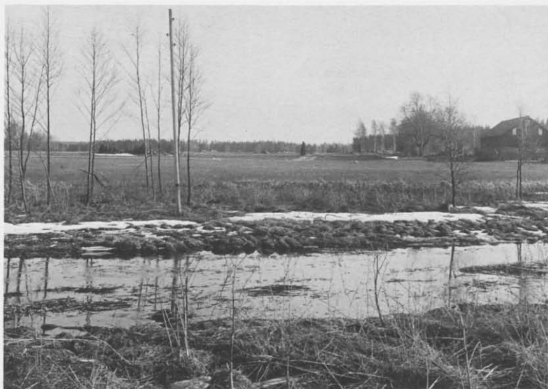
Fig. 3. Björklingeån från västra stranden. Runstens ursprungliga plats bakom träden till vänster några meter in i åkern. Vid enen i bakgrunden den i texten omnämnda bruksvägen. Till höger Åbys ladugård. – The Björklingeån from the western bank. The original location of the runestone behind the trees to the left a few metres inside the field. By the juniper in the background the road mentioned in the text. To the right the cow-house at Åby.

nämnda inventeringen »funnts 2 obetydliga gravar. Bortodlades omkring 1880». Runstenen stod strax invid detta gravfält. Några hundra meter norr om Lund har tydligen en forntida väg vikit av västerut från stora vägen till Björklinge; svaga spår kan möjligen urskiljas i skogsbacken ner mot åkern. På andra sidan gårdet sammanföll den kanske med den nuvarande bruksvägen som leder fram till byvägen strax norr om Åby gård (fig. 3). Vidare ner mot ån, genom bygravfältet, förbi runstenen som markerade det nybyggda eller åtminstone renoverade vadstället, över ån, genom Örkes bygravfält och fram till Skuttunges sockenväg. Det har i alla tider fun-