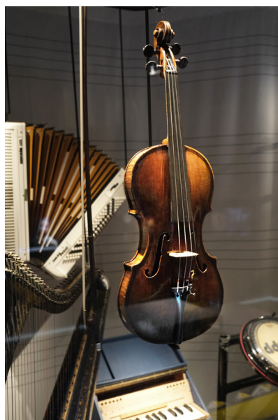
Svävande montering av objekt i Scenkonstmuseets monstrar.