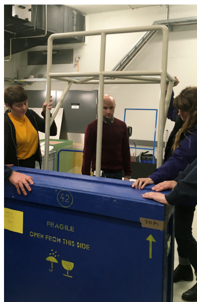
Deltagare provar lådtillt vid studiebesök på Nationalmuseum.